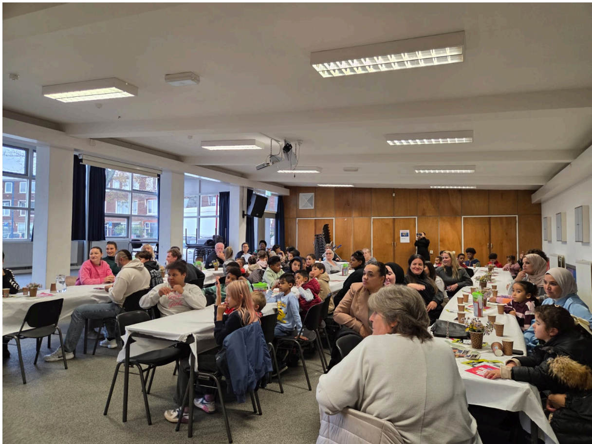
Grote Wijkdiner Tarwewijk locatie Speeltuin Tarwewijk, 1 van de 11 locaties in 2025.

De Wijkhub Tarwewijk stond op de planning te verdwijnen. De Wijkraad heeft succesvol gelobbyed voor behoud van een Wijkhub in de wijk en heeft een nieuwe locatie aangewezen. Vanaf einde 2025 is de Wijkpost geopend in de Speeltuin Tarwewijk, midden in het hart van de wijk.