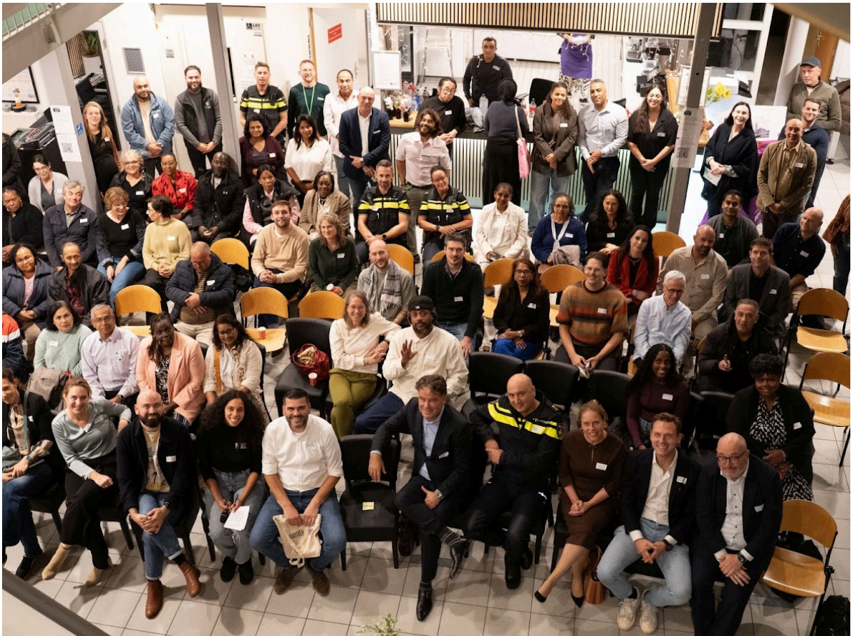
Bijeenkomst Veiligheid met B&W, najaar 2025.

Een bijzonderheid dit kalenderjaar is de komst van de Stadsmarinier in Tarwewijk. Mede ingegeven door de uitkomsten van de Veiligheidsindex (2024) gaat er vanaf 2025 extra liefde naar de Tarwewijk en levert het stadsbestuur meer inzet op onderwerpen die de veiligheid en leefbaarheid van de wijk raken, kernonderwerpen van de Wijkraad zoals ook opgesteld in de Wijkvisie van 2022. De wijkraad is bijzonder blij met deze inzet van het stadsbestuur en we zijn trots dat we actief hebben kunnen bijdragen aan de onderwerpen (zoals de komst van de Jongerenhub) en planvorming. Zodoende krijgen verschillende onderwerpen geadresseerd door de wijkraad in de wijkvisie en jaaractieplannen versneld aandacht en uitvoering.