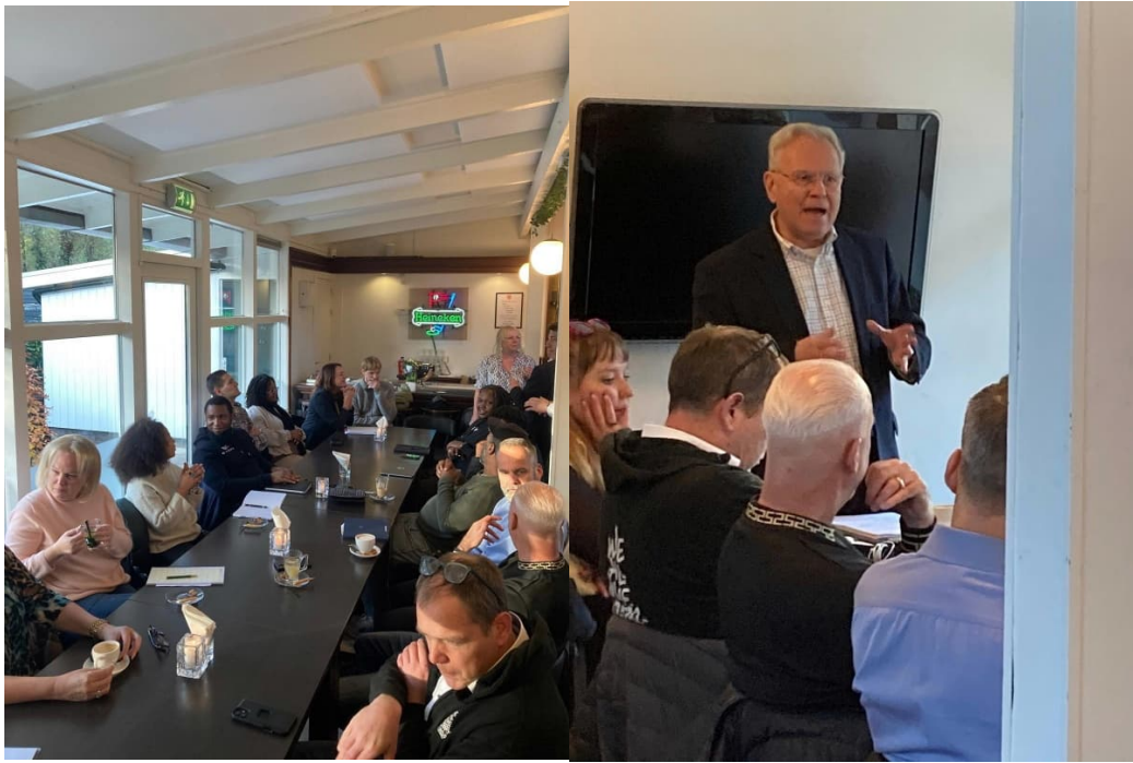
Wijkraad in gesprek met de stad en de netwerkpartners