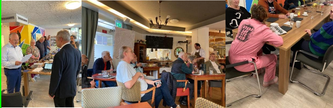
Binnen of buiten, in gesprek...