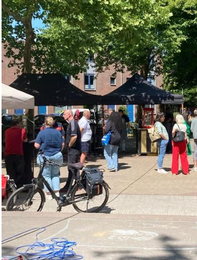
In de zomer of in de winter....